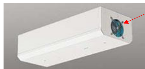
紫外線殺菌器（空気循環型）